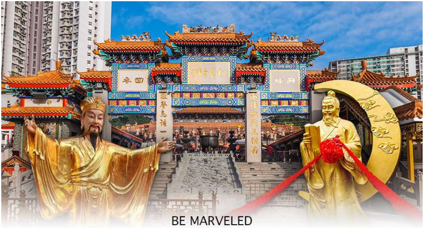
BE MARVELED วัดหวังต้าเซียน

พระหวังต้าเซียน หรือที่รู้จักกันในชื่อ ฮวงชูปิง (Huang Chu-ping) ในช่วงประมาณศตวรรษที่ 4 ได้เดินทางจากเมืองจินมาเผยแผ่ศาสนาในฮ่องกง และสร้างวัดแห่งนี้ขึ้นมาเมื่อประมาณปีค.ศ. 1921 ค่ะ ภายในวัดจะมีทั้ง เทพเจ้าหวังต้าเซียน, เจ้าแม่กวนอิม, เจ้าที่, เทพเจ้าหยุกโหลว (เทพเจ้าแห่งความรัก), ท่านขงจื้อ ซึ่งคนฮ่องกงเอง และนักท่องเที่ยวก็จะมากราบไหว้เพื่อสิริมงคลกัน โดยเฉพาะอย่างยิ่งคือ เทพเจ้าหยุกโหลว หรือ เทพเจ้าแห่งความรัก ที่เราเรียกกันว่า เทพเจ้าด้ายแดง เป็นพิภดที่หลายๆ คนมักจะไปขอความรักจากท่านกัน นอกจากนี้ที่เราจะต้องเอาด้ายแดงมาพันมือนี้อีก ตามป้ายที่แนะนำข้างหน้าแล้ว ไกด์นำเที่ยวคนฮ่องกงบอกว่าถ้าเป็นผู้หญิงอย่างเราอยากได้แฟน ก็ต้องไปผูกด้ายที่รูปปั้นผู้ชายและพอไหว้เสร็จแล้วก็อย่าลืมหยอดทำบุญใส่ตู้ไปด้วย