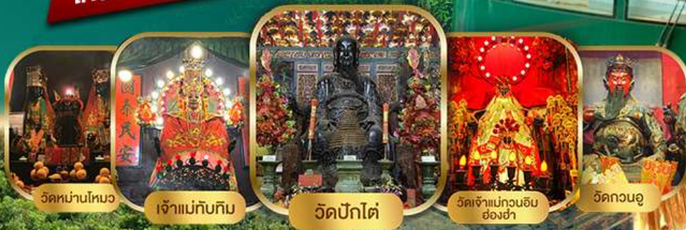
วัดหนานโหมว

ไหว้พระเสริมดวงแบบจัดเต็ม รวมขึ้นพีคแกรม