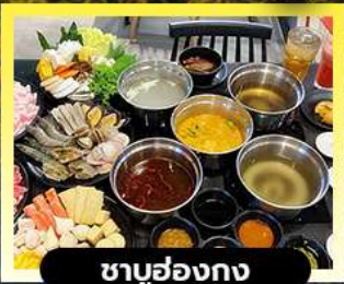
ซาบู่ฮ่องกง