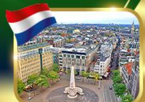
จัตุรัสดีนสแควร์ อัมสเตอร์ดัม