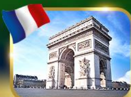
ประตูชัยฝรั่งเศส ปารีส