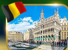
จัตุรัสกรอนด์ ปลาซ บริซเซลส์