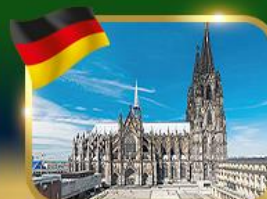
มหาวิหารแห่งเมืองโคโลญ