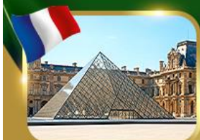
พีระมิดที่ลูฟวร์ ปารีส