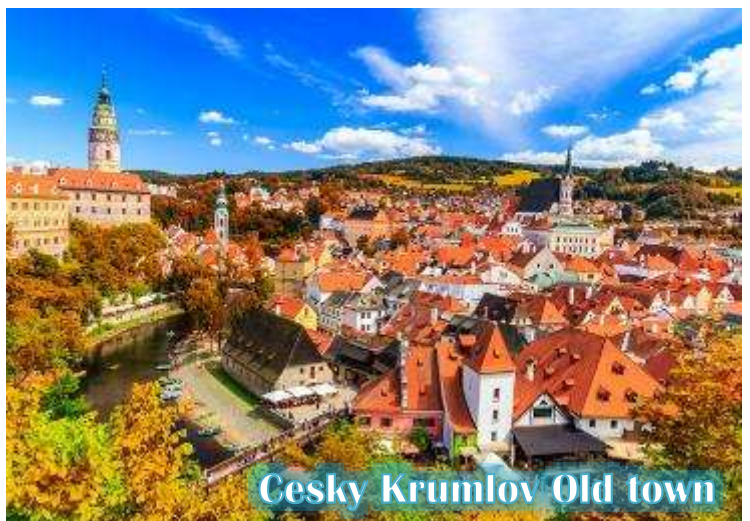
Cesky Krumlov Old town

บ่าย นำท่านเดินทางสู่ “เมืองเชสกี้ ครุมลอฟ (เมืองมรดกโลก)” เป็นเมืองขนาดเล็กในภูมิภาคโบฮีเมียใต้ของ สาธารณรัฐเช็กมีชื่อเสียงจากสถาปัตยกรรม และศิลปะของเขตเมืองเก่าและปราสาทครุมลอฟ ที่ยังคงมีเสน่ห์เหมือนอยู่ในเทพนิยายมาจนถึงทุกวันนี้ และน่าจะเป็นเมืองที่สวยงามที่สุดใน สาธารณรัฐเช็ก, เชสกี้ ครุมลอฟได้รับการจัดอันดับให้อยู่ในสิบเมืองที่สวยงามที่สุดในโลก เป็นหนึ่งในสถานที่ที่สวยงามที่สุดและไม่ควรพลาด ในการเดินทางไปสาธารณรัฐเช็ก เดินเล่นไปบนถนนในยุคกลาง ปราสาทสไตล์บาโรกที่ไม่บุบสลาย และแม่น้ำที่คดเคี้ยว เมืองเก่าที่งดงามแห่งนี้ได้รับการอนุรักษ์ไว้อย่างดีจากอดีตและการทิ้งระเบิดใน สงครามโลกครั้งที่ 2 ทั้งหมดทำให้เมืองที่มีทิวทัศน์แห่งนี้รู้สึกเหมือนอยู่ในเทพนิยายจากยุคกลางสู่ความเป็นจริง