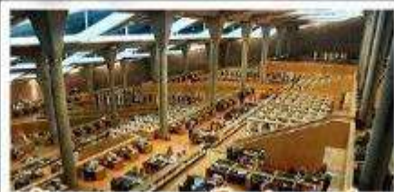
ห้องสมุดอเล็กซานเดรีย