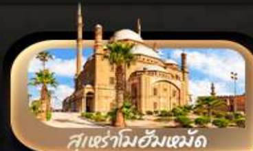
สุเหร่าอิหม่ามตุลูน