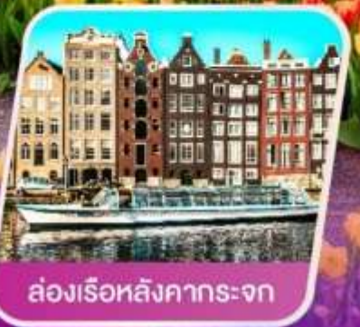
ล่องเรือหลังคากระຈก