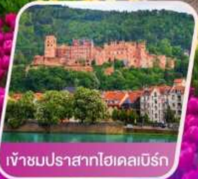
เข้าชมปราสาทไฮเคลมเบิร์ก