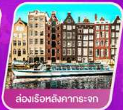
ส่องเรือสิงคภาทรงงก