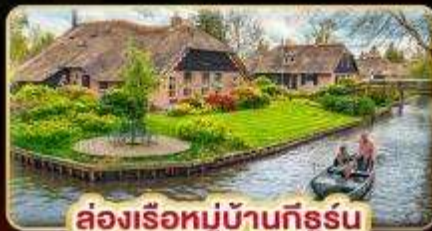
ล่องเรือหมู่บ้านกังหัน