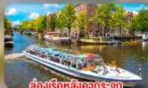
สองเรือหลังคากระจก