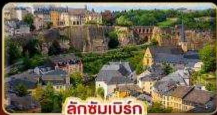
ลักซิมเบิร์ก

ที่สุดของธรรมชาติ แห่ง “ยุโรป” สวนดอกไม้ KEUKENHOF 1ปีมีครั้งเดียว