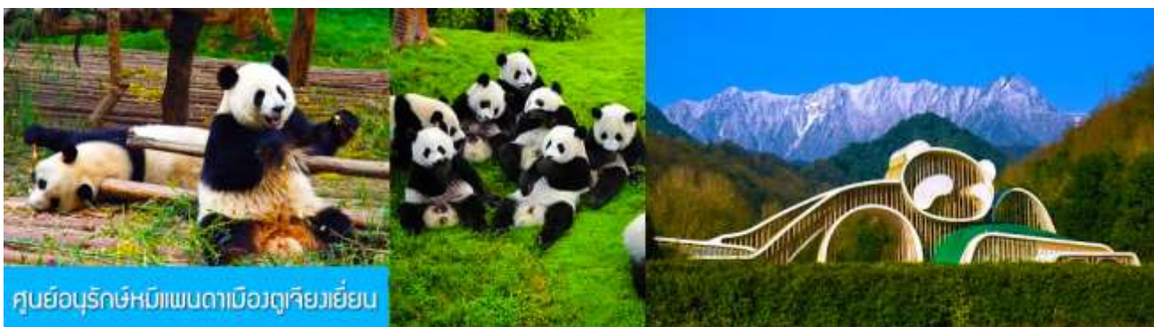
ศูนย์อนุรักษ์หมีแพนด้าเมืองตูเจียงเยียน

หลังอาหารท่านสามารถเลือกที่จะซื้อ โปรแกรมทัวร์เสริม หรืออิสระพักผ่อนตามอัธยาศัยใน โรงแรม