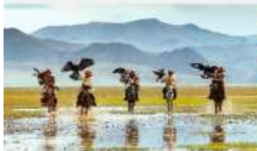
ชมพ่อกองโกเลีย