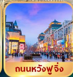
ถนนหวงฟู่จิ่ง