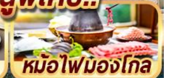
หม้อไฟมองโกเลีย