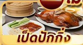
เป็ดปักกิ่ง