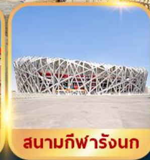
สนามกีฬาแห่งชาติ