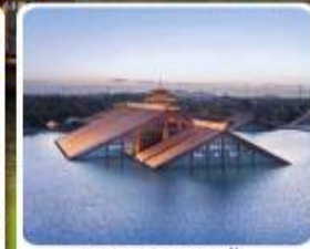
พิพิธภัณฑ์ไดน้ำกงฟู่หลิน