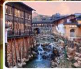
เมืองโบราณเหย้าหู