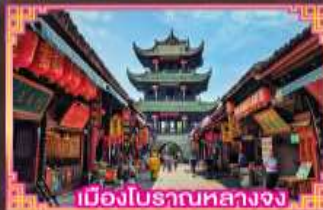
เมืองโบราณหลวงจง