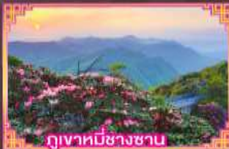
ภูเขาที่มีชาวชน