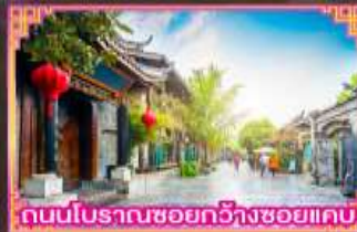
ถนนโบราณซอยกว้างซอยแคบ