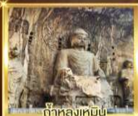
ถ้ำหลงเหมิน