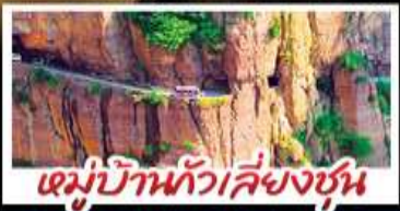
หมู่บ้านทิวเสี่ยงซุน