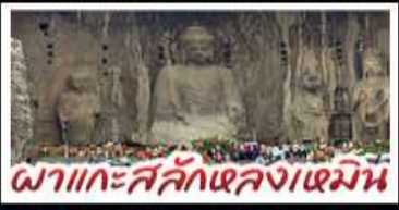
ผาแกะสลักหลงเหมิน

เที่ยวครบ 4 มรดกโลก ถ้ำหลงเหมิน - สุสานฉินซีฮ่องเต้ - วัดส่าหลิน หมู่บ้านใต้ดินสามโจ้ว - หมู่บ้านทิวเสี่ยงซุน