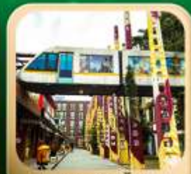
“ตงเจียวจี้”