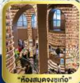
"ห้องสมุดจงซูเก๋อ"