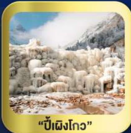
"ปี้ผิงโกว"

นั่งกระเช้าชมวิว ภูเขาหิมะต้ากู่กลาเซียร์ • ชมความสวยงาม ณ อุทยานปี้ผิงโกว ห้องสมุดจงซูเก๋อ • ศูนย์หมีแพนด้า • ตงเจียวจี้ • ซอยกวางฮอยแคบ