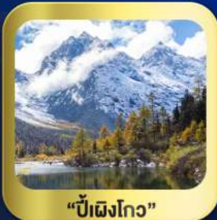
"ปี้ผิงโกว"