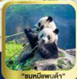
"ชมหมีแพนด้า"