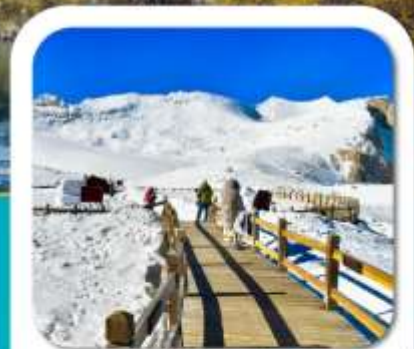
"ต้ากุกลาเซียร์"

เที่ยวชมความงาม 3 อุทยานชื่อดัง : สี่ดรุณี • ป่าเผิงโกว ต้ากุกลาเซียร์ ชมความน่ารักของหมีแพนด้า • จัตุรัสหยางเทียนวู่ ชอยกวางชอยแคม • ถนนคนเดินซุนซีลู่ • POP MART