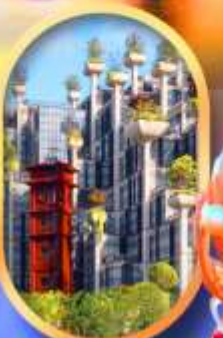
อาคาร 1,000 คับไม้