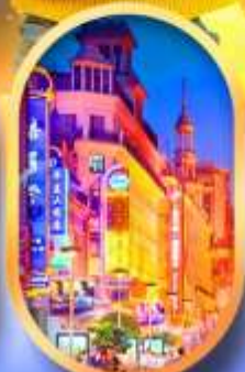
ถนนหนานกิง