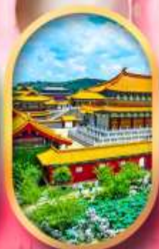
เมืองจำลองสามก๊ก