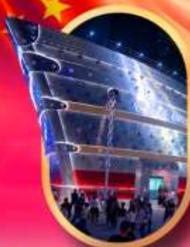
เรือคะหลุยส์