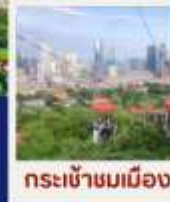
กระบี่เข้าขมเมือง