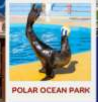
POLAR OCEAN PARK