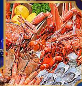
อาหารซีฟู้ดจัดเต็ม

บุฟเฟ่ต์เบียร์ไม่อื่น + ซีฟู้ด + ปิ้งย่างเกาหลี