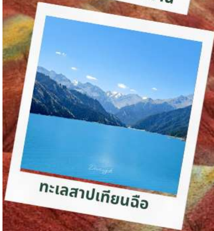
ทะเลสาปเทียนฉือ