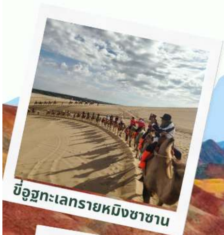
ขบวนคาราวานอูฐทะเลทรายหมิงซาซาน