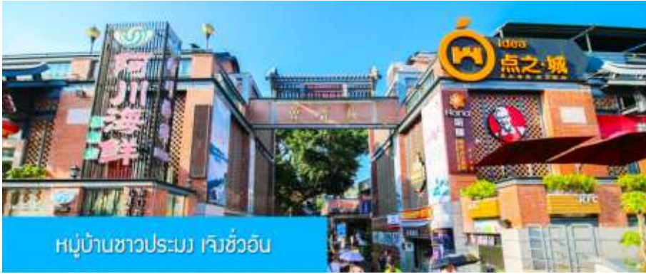
หมู่บ้านชาวประมง เจิงชว้ออัน