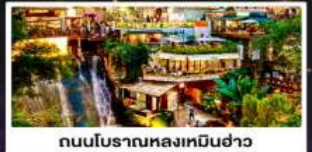
ถนนโบราณหลงเหมินฮ่าว