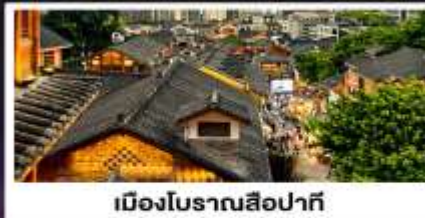
เมืองโบราณสี่ปาที้