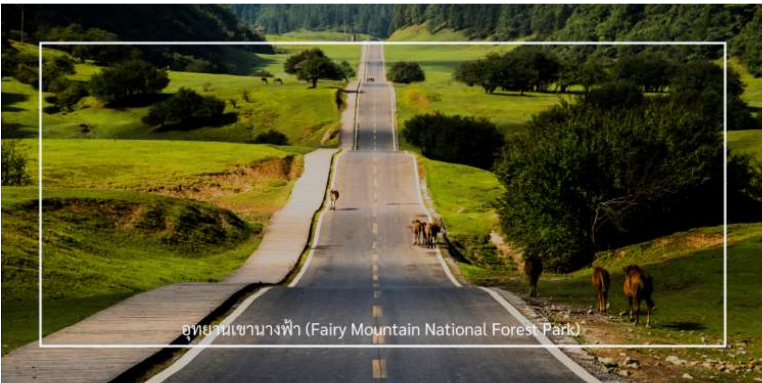
อุทยานเขานางฟ้า (Fairy Mountain National Forest Park)

อุทยานเขานางฟ้า ตั้งอยู่ในเขตอู่หลง มหานครฉงชิ่ง ประเทศจีน เป็นสถานที่ท่องเที่ยวทางธรรมชาติระดับ 5A ของประเทศ โดดเด่นด้วยภูมิประเทศแบบที่ราบสูงอัลไพน์ ปกคลุมด้วยทุ่งหญ้ากว้าง ป่าไม้เขียวขจี และยอดเขาสลับซับซ้อนสวยงามราวภาพวาด ด้วยบรรยากาศเย็นสบายตลอดทั้งปี ที่นี่จึงได้รับฉายาว่า “สวิตเซอร์แลนด์แห่งจีน” อุทยานครอบคลุมพื้นที่กว่า 330 ตารางกิโลเมตร มีระดับความสูงเฉลี่ยกว่า 2,000 เมตรจากระดับน้ำทะเล ภายในท่านสามารถเพลิดเพลินกับการเดินเล่นชมธรรมชาติบน ‘สะพานสวรรค์’ (Glass Skywalk) ชมทิวทัศน์อันงดงามของภูเขาและทะเลหมอก พร้อมบริการรถไฟขบวนเล็ก ที่จะพาท่านชมวิวมกกลางธรรมชาติได้อย่างสะดวกสบาย