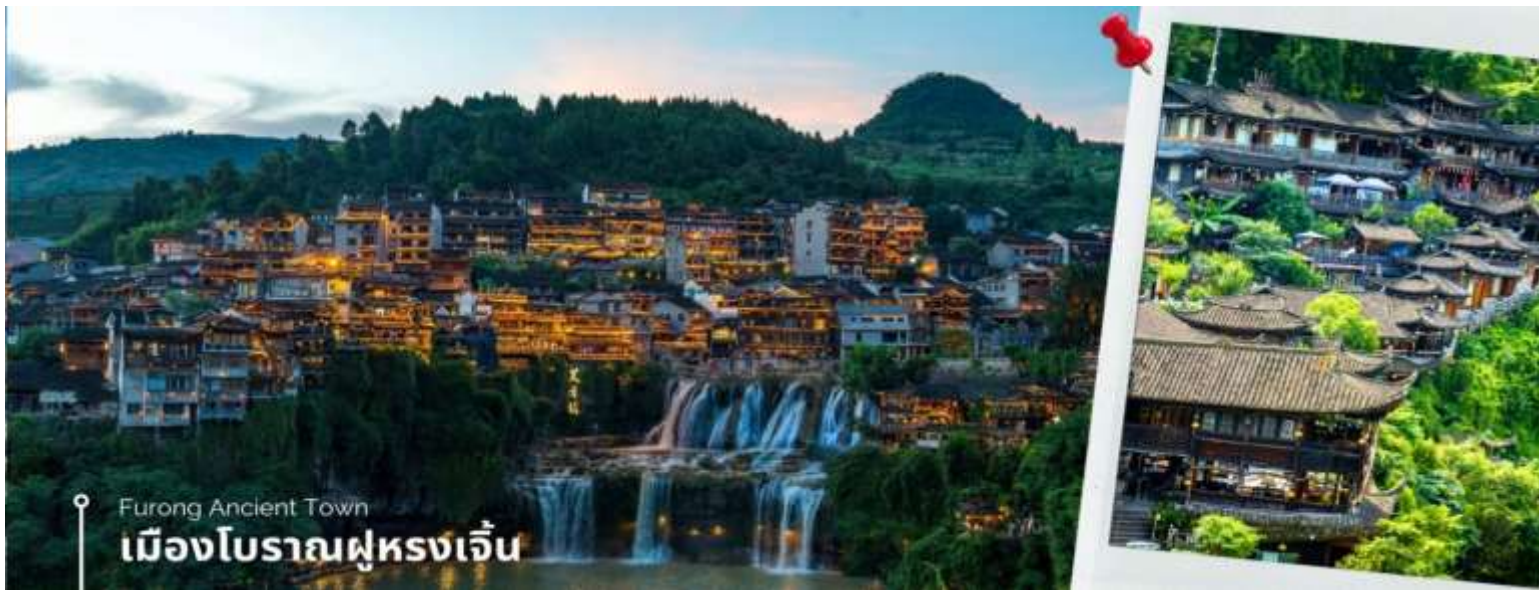
Furong Ancient Town เมืองโบราณฝูหลงเจิ้น

ท่านสามารถ ชมโชว์วัฒนธรรมฝูหลงโบราณ (หากสภาพอากาศไม่อำนวย จะงดการแสดง) จากนั้นนำท่าน ชมความงาม น้ำตกฝูหลง ซึ่งเป็นเอกลักษณ์ของเมืองฝูหลง เป็นน้ำตกที่อยู่ใจกลางเมือง ถ้ามองจากฝั่งตรงข้ามจะดูเหมือนว่าเมืองตั้งอยู่บน หน้าผาที่มีน้ำตกไหลอยู่ข้างล่าง น้ำตกนี้มีขนาดกว้างประมาณ 40 เมตร และสูงประมาณ 60 เมตร ซึ่งความพิเศษอีกอย่าง ของที่นี่คือ เราสามารถเดินผ่านด้านหลังม่านน้ำตกได้