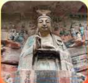
"ผาหินแกะสลักต้าจู้"