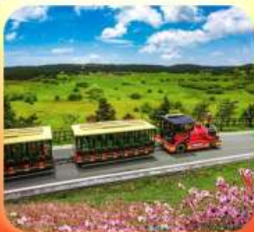
"อุทยานเขานางฟ้า"

บินตรงลงชิง • อยู่หลง หลุมฟ้าสะพานสวรรค์ • ระเบิดยงแกว • อุทยานเขานางฟ้า หงหยาดัง • นั่งรถไฟทะลุติ๊ก • ล่องเรือชมฉางชิ่งยามค่ำคืน • ศาลาประชาคม (ด้านนอก) มรดกโลกผาหินแกะสลักต้าจู้ • เมืองโบราณสี่ปาที้ • วัดหลิวฮั่น • ตึกตะเกียบ