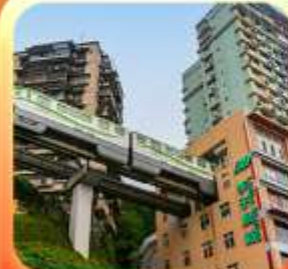
"นั่งรถไฟทะลุติ๊ก"