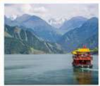
ห้องเรือทะเลสาบเทียนฉือ