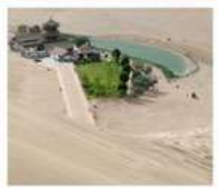
เขื่อนทรายหมิงซาซาน