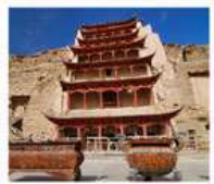
ถ้ำม่อเถาตุ