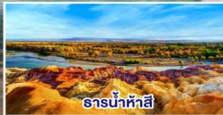
ธารน้ำห้าสี