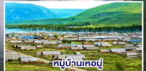
หมู่บ้านทอผ้า