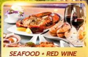
SEAFOOD + RED WINE