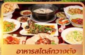
อาหารสไตล์กวางตุ้ง