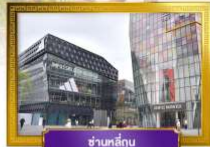
ชานหลู่กุน