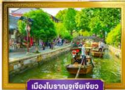
เมืองโบราณซูโจว