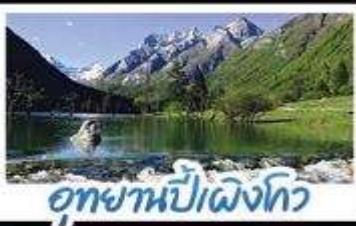
อุทยานปี่เป็งโกว

ภูเขาลี้ดรุณี อุทยานจิวจ้ายโกว นั่งรถไฟความเร็วสูง น้ำพุไม้ไฟตักSKP อุทยานปี่เป็งโกว วัดต้าฉือ ถนนโบราณชอยกว้างชอยแคม ช้อปปิ้งถนนไท่กู่หลี่ + ถนนชุนซีลู่