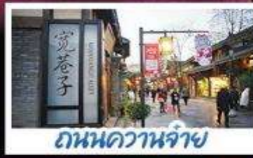
ถนนควานจ้าย