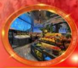
มือพิเศษ บุฟเฟต์นานาชาติ