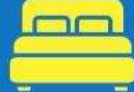
ห้องพักดับเบิล DOUBLE