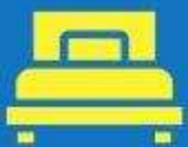
ห้องพักเดี่ยว SINGLE

ตัวอย่างประเภทห้องพัก *เป็นเพียงตัวอย่างเพื่อให้เห็นภาพสำหรับประเภทห้องในแบบต่างๆ