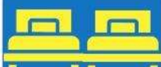
ห้องพักเตียงคู่ TWIN