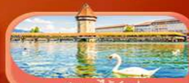
สะพานไม้ซังปก

Highlight เยือนหมู่บ้านแสนสวยเซอร์แมท เช็กอินศาลาไทยสุดงามที่โลซาน เที่ยวลูเซิร์น ชมสะพานไม้ซังและอนุสาวรีย์สิงโต ซาลี แพลสซึน ชมประติมากรรม The Fork และปราสาทซิลลองริมทะเลสาบ เยือนมิลาน มหาวิหารดูโอโม เที่ยวเวนิส เมืองลอยน้ำสุดโรแมนติก อินกับรักอมตะที่บ้านจูเลียต และช้อปปิ้งจุใจที่ Serravalle Outlet