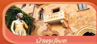
บ้านจูเลียต