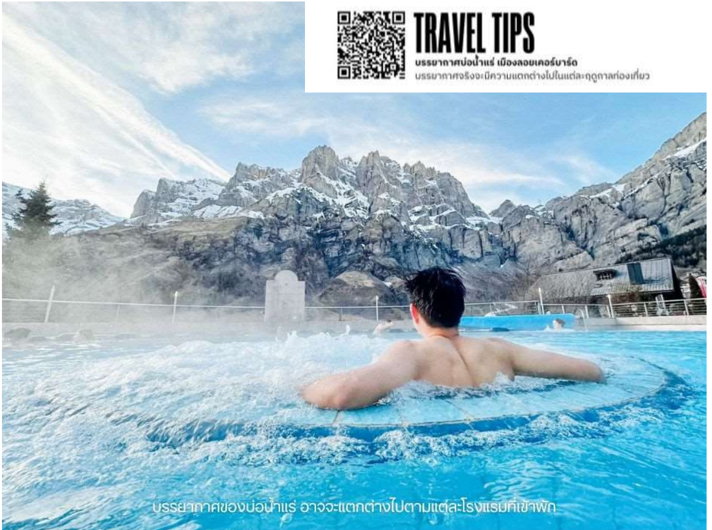
บรรยากาศของบ่อน้ำแร่ อาจจะไม่แตกต่างกันไปตามแต่ละโรงแรมที่เข้าพัก

บรรยากาศบ่อน้ำแร่ เมืองลอยเคอร์บาด บรรยากาศจริงจะมีความแตกต่างไปในแต่ละฤดูกาลท่องเที่ยว