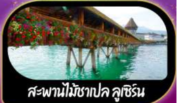
สะพานไม้ชาปค ลูซิิร์น