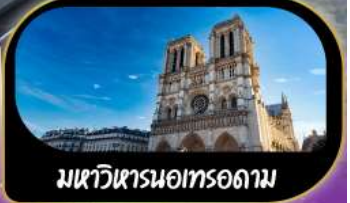
มหาวิหารนอทรอดาม