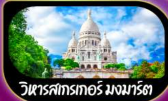
วิหารสกรทอร์ มงมาร์ต