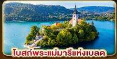
โบสถ์พระแม่มารีย์แห่งเบลด