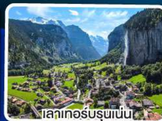
ลาเทอส์บรุนเนน