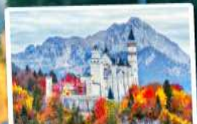
ปราสาทน้อยชวานสไตน์

09-15, 15-21 ต.ค. 68 23-29 ม.ค. / 25 ก.พ.-03 มี.ค. 69 06-12, 18-24 มี.ค. 69 01-07, 09-15, 10-16, 12-18 เม.ย. 69 29 เม.ย.-05 พ.ค. / 30 เม.ย.-06 พ.ค. 69 28 พ.ค.-03 มิ.ย. 69